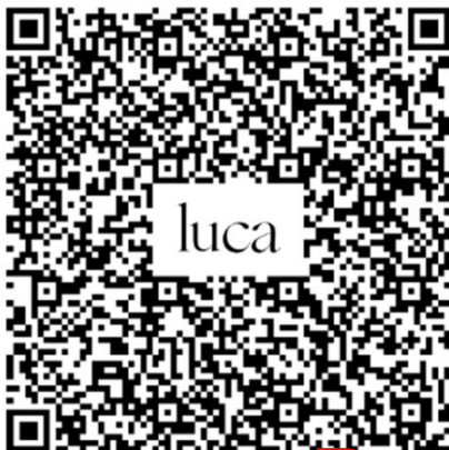
Sportplätze TuS Nortorf